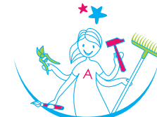
bricolAge & jardin BRICOLAGE - JARDINAGE