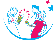
écoute & Assistance TÉLÉASSISTANCE