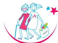
Autonomie & réconfort AIDE À LA PERSONNE