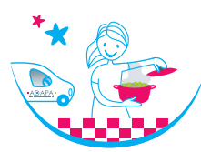
mitonnAge PORTAGE DE REPAS