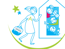
babyAge & coloriage GARDE D'ENFANTS À DOMICILE