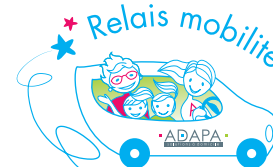
Relais mobilité DÉPLACEMENTS ACCOMPAGNÉS