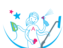
ménAge & liberté MÉNAGE - REPASSAGE